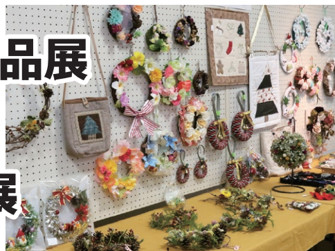
あったかクリスマス作品展