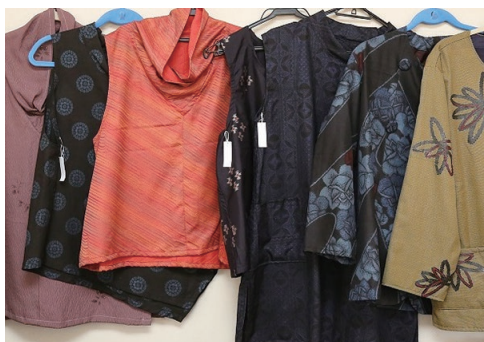
和布でリメイク作品展